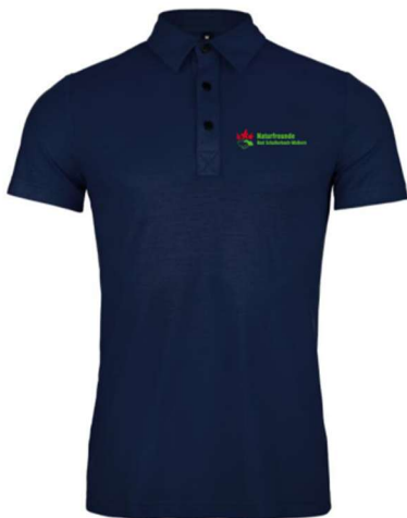
Merino Polo dunkelblau

Kosten für die Mitglieder sind: Polo 35,00 Euro | Shirt 30,00 Euro | Nackenwärmer 13,00 Euro