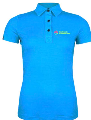
Merino Polo blau