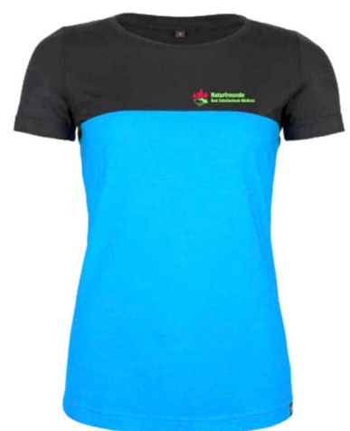
Merino Shirt schwarz/blau

Die genauen Anprobeterminen werden in den Naturfreunde - WhatsApp Gruppen bekanntgegeben.