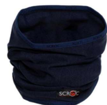
Merino Nackenwärmer dunkelblau auch als Gesichtsschutz, Stirnband oder Haube geeignet